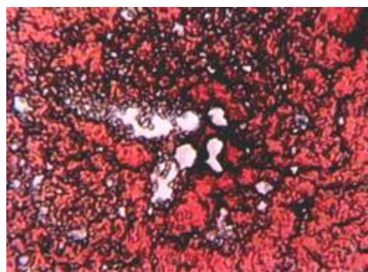
Blutbild eines jungen Malers vor einer MSM-Kur. Das Blutbild zeigt starke Belastungen mit verschiedenen Schwermetallen.

Michael Labiner erklärt den Wirkmechanismus in seinem weiter oben erwähnten Aufsatz so: „MSM kann sich an die Schleimhaut binden, wodurch eine natürliche Schutzschicht zwischen Körper und Allergenen entsteht. Es lindert nicht nur die Symptome bei Nahrungsmittel-, Kontakt- und Inhalations-Allergien, es verhindert zudem, dass sich neue Allergene oder Parasiten wie Trichinen und Darmwürmer auf der Schleimhaut festsetzen. MSM hemmt die Histaminfreisetzung mindestens ebenso gut wie herkömmliche Antihistaminika, aber ohne deren fatale