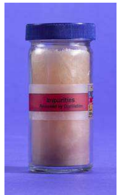
MSM - Es gibt

Nahezu 70% der Frauen und eine große Anzahl von Männern leiden mit zunehmendem Alter an Arthritis der Gelenke. Diese Form der Arthritis beginnt mit dem Abbau und der Degeneration der Knorpelmasse und führt im weiteren Verlauf durch schmerzhaft Entzündungen der befallenen Gelenke manchmal auch zu Zystenbildung. Die konventionelle Medizin behandelt das mittels schmerzlindernden und entzündungshemmenden Pharmazeutika, die oft unangenehme Nebenwirkungen aufweisen. Bei einer vergleichenden Studie an Patienten erreichte MSM die selben schmerzvermindernden und entzündungshemmenden Erfolge wie handelsübliche Medikamente und war dabei äußerst verträglich.