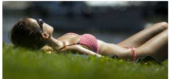
Ein vernünftiges Maß an Sonne nutzt der Gesundheit

in der medizinischen Wärmetherapie genutzt. Ultraviolette Strahlen sind am kurzwelligsten und sind Grundlage der Vitamin-D-Produktion. Man teilt sie in drei Bereiche ein: