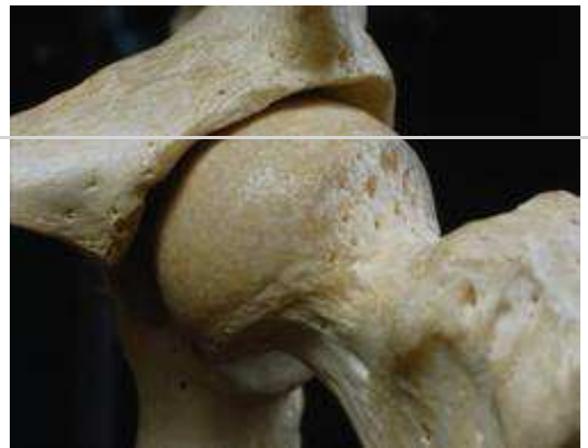
Eine ausreichende Versorgung mit Vitamin D führt zu robusten Knochen

Rachitis war während der ersten Industrialisierungswelle die „Standardkrankheit“ bei Kindern. Ursache waren Arbeitsplätze ohne Tageslicht und hohe Luftverschmutzung durch rauchende Fabrikschlote. Bei dieser Entwicklungsstörung bleiben die Knochen weich wie Knorpel. Der Vitamin-D-Mangel bringt den Calciumhaushalt ins Ungleichgewicht, dadurch werden Probleme im Knochenstoffwechsel ausgelöst. Sobald kleine Kinder das Sitzen, Krabbeln und Gehen erlernen und die Schwerkraft auf die weichen Knochen wirkt, bilden sich Verformungen wie X- oder O-Beine aus. Uncharakteristische Symptome, die bereits vorher ins Auge fallen, sind Unruhe, Schreckhaftigkeit, vermehrtes Schwitzen mit juckenden Hautausschlägen..., später kommt es zu Muskelschmerzen und „Froschbauch“, Verstopfungsneigung und ersten Knochenerweichungen am Kopf, zusätzlich sind Krämpfe möglich.